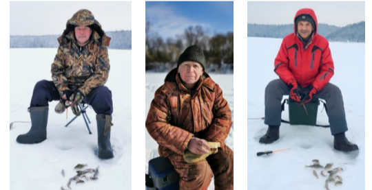
Делу время - рыбалке час...

Всё перечисленное является итогом развала единого организма энергосистемы.